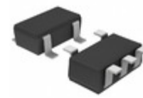
BD45271G-TR Rohm Semiconductor IC RESET OD 2.7V 100MS 5SSOP