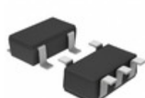
BD45252G-TR Rohm Semiconductor IC RESET OD 2.5V 200MS 5SSOP