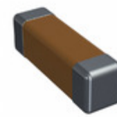
CDR02BX472BKWSAJ Electro-Films (EFI) / Vishay CAP CER 4700PF 100V BX 1805