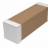
CDR02BX472BKZPAT Vishay Vitramon CAP CER 4700PF 100V 10% BX 1805