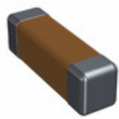
CDR02BX472BKWSAR Electro-Films (EFI) / Vishay CAP CER 4700PF 100V BX 1805