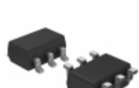
PL602-22TC Microchip Technology IC CLK BUFFER 125MHZ 6SOT23