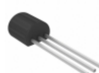
TC54VC4102EZB Microchip Technology IC VOLT DETECTOR TO-92-3