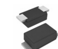
BZD27C24P-E3-18 Electro-Films (EFI) / Vishay DIODE ZENER 800MW SMF DO219