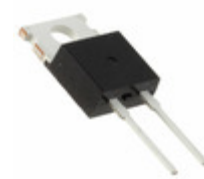
DPG10I200PA IXYS DIODE GEN PURP 200V 10A TO220AC