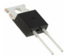
DPG15I200PA IXYS DIODE GEN PURP 200V 15A TO220AC