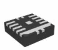
MP9186GQ-Z Monolithic Power Systems Inc. IC REG BUCK ADJ 6A SYNC