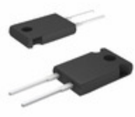
MP925-20.0K-1% Caddock Electronics Inc. RES 20K OHM 25W 1% TO220