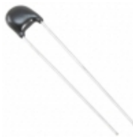
ERZ-E05A201CS Panasonic Electronic Components VARISTOR 200V 1.2KA DISC 7MM