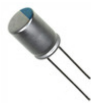
477UER6R3MEF Illinois Capacitor CAP ALUM POLY 470UF 20% 6.3V T/H