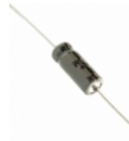
477TTA063M Illinois Capacitor CAP ALUM 470UF 20% 63V AXIAL