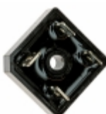
MP506 Micro Commercial Co RECT BRIDGE 50A 600V W/O LEADS