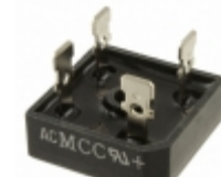
MP506-BP Micro Commercial Co RECT BRIDGE 50A 600V W/O LEADS