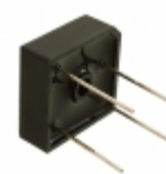
MP506W Micro Commercial Co RECT BRIDGE 50A 600V WIRE LEADS