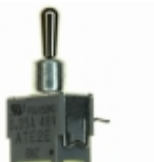
ATE2N-5M3-10-Z Copal Electronics Inc. SWITCH TOGGLE DPDT 50MA 48V