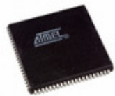
ATF1504AS-10JU84 Microchip Technology IC CPLD 64MC 10NS 84PLCC