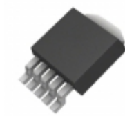
MIC5295-3.0YD-TR Microchip Technology IC REG LDO 3V 0.15A TO252-5