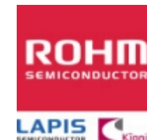
BD6203FS-E2 ROHM BD6203FS-E2 ROHM