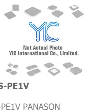
AN8038S-PE1V PANASON AN8038S-PE1V PANASON