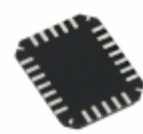
AN8049FHNEBV Panasonic Electronic Components IC REG CTRLR BUCK/BOOST 24QFN