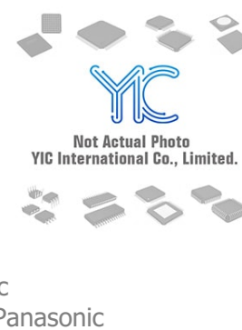
AN8038 Panasonic AN8038 Panasonic