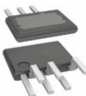
TOP271EG Power Integrations IC OFFLINE SW PWM OCP OVP 7ESIP