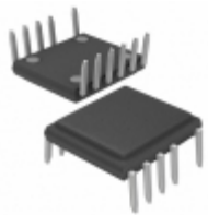
TOP270VG Power Integrations IC OFFLINE SW PWM OCP OVP 12EDIP