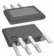
TOP270EG Power Integrations IC OFFLINE SW PWM OCP OVP 7ESIP