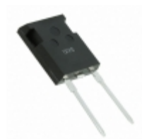
IXFX210N30X3 IXYS Corporation 300V/210A ULTRA JUNCTION X3- CLAS