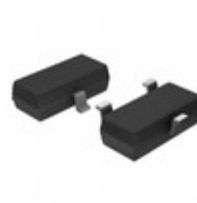
MCP1703AT-2052E/CB Microchip Technology IC REG LDO 2.05V 0.2A SOT23A