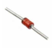
MP4KE22A Microsemi Corporation TVS DIODE 18.8VWM 30.6VC DO41