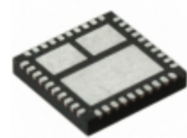
FDMF6821A Fairchild/ON Semiconductor MODULE DRMOS 60A 40-PQFN