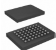
SST38VF6403-90-5I-B3KE Microchip Technology IC FLASH 64MBIT 90NS 48TFBGA