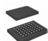
SST38VF6403-90-5C-B3KE Microchip Technology IC FLASH 64MBIT 90NS 48TFBGA