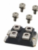
APT30DS20HJ Microsemi Corporation DIODE MODULE 200V SOT227