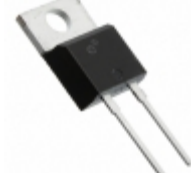
APT30DQ60KG Microsemi Corporation DIODE GEN PURP 600V 30A TO220