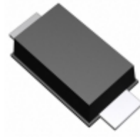
KDZTR10B Rohm Semiconductor DIODE ZENER 10.3V 1W PMDU