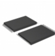
AT27BV010-90VC Microchip Technology IC OTP 1MBIT 90NS 32VSOP