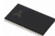
AS7C31026B-12TCNTR Alliance Memory, Inc. IC SRAM 1MBIT 12NS 44TSOP