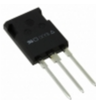
DSEP30-12AR IXYS DIODE GEN 1.2KV 30A ISOPLUS247