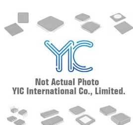
Q14MC1461000200 Original SMD