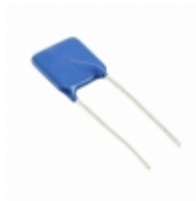
Q14K175 EPCOS (TDK) VARISTOR 270V 8KA RADIAL