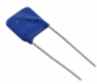
Q14K275 EPCOS (TDK) VARISTOR 430V 8KA RADIAL