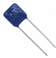
Q14K320 EPCOS (TDK) VARISTOR 510V 8KA RADIAL