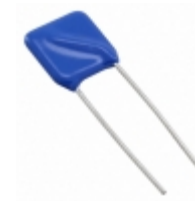
Q14K140 EPCOS (TDK) VARISTOR 220V 8KA RADIAL