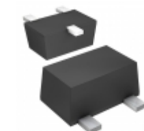
DTA014YUBTL Rohm Semiconductor TRANS PREBIAS PNP 50V 0.2W UMT3F