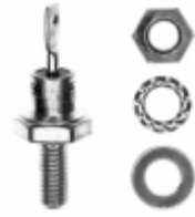
VS-16F80M Electro-Films (EFI) / Vishay DIODE GEN PURP 800V 16A DO203AA