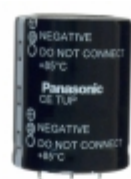
ECE-T2WP681FA Panasonic Electronic Components CAP ALUM 680UF 20% 450V SNAP