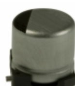
ECE-V0GA101SR Panasonic Electronic Components CAP ALUM 100UF 20% 4V SMD