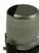
ECE-V0GA470SR Panasonic Electronic Components CAP ALUM 47UF 20% 4V SMD