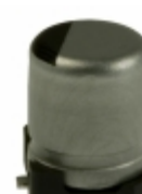
ECE-V0JA101SP Panasonic Electronic Components CAP ALUM 100UF 20% 6.3V SMD