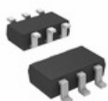
DG447DV-T1-E3 Electro-Films (EFI) / Vishay IC SWITCH SPST 25 OHM 6TSOP