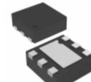
RT9081A-11GQZA Richtek IC REG LINEAR 1.1V 500MA 6ZADFN