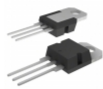
MIC29310-3.3WT Microchip Technology IC REG LDO 3.3V 3A TO220-3