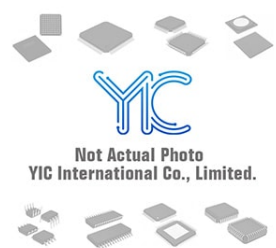
MIC29310-3.3WUTR MICREL MICREL TO263-3