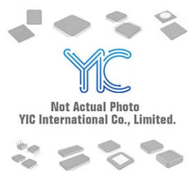
MIC29310-3.3YT MICREL MICREL TO-220