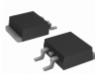
MURD620CTTR Electro-Films (EFI) / Vishay DIODE ARRAY GP 200V 3A DPAK