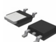
MURD620CTT4G ON Semiconductor DIODE ARRAY GP 200V 3A DPAK