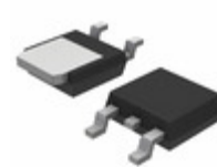
MURD620CTG ON Semiconductor DIODE ARRAY GP 200V 3A DPAK