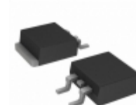
MURD620CTTRL Electro-Films (EFI) / Vishay DIODE ARRAY GP 200V 3A DPAK