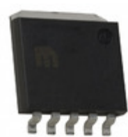
MIC37301-2.5WR Microchip Technology IC REG LDO 2.5V 3A SPAK-5