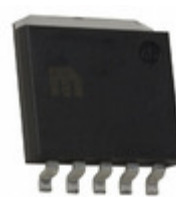
MIC37301-2.5WR-TR Microchip Technology IC REG LDO 2.5V 3A SPAK-5