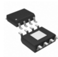
MIC37301-1.8YME-TR Microchip Technology IC REG LDO 1.8V 3A 8SOIC