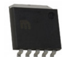
MIC37301-1.8WR-TR Microchip Technology IC REG LDO 1.8V 3A SPAK-5