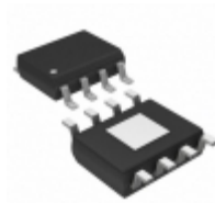
MIC37301-2.5YME Microchip Technology IC REG LDO 2.5V 3A 8SOIC