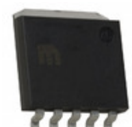
MIC37301-2.5BR Microchip Technology IC REG LDO 2.5V 3A SPAK-5