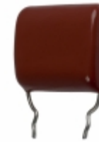
ECQ-P1H364FZW Panasonic Electronic Components CAP FILM 0.36UF 1% 50VDC RADIAL