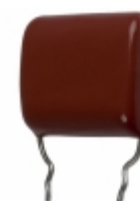
ECQ-P1H334FZW Panasonic Electronic Components CAP FILM 0.33UF 1% 50VDC RADIAL