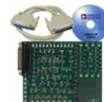
AD5247EVAL ADI (Analog Devices, Inc.) BOARD EVAL FOR AD5247