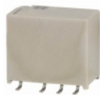
AGN200S24Z Panasonic Electric Works RELAY TELECOM DPDT 1A 24V