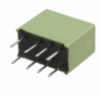
AGN21006 Panasonic Electric Works RELAY TELECOM DPDT 1A 6V