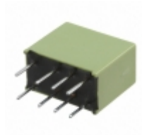
AGN21009 Panasonic Electric Works RELAY TELECOM DPDT 1A 9V