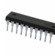
74LV244N,112 NXP USA Inc. IC BUFF/DVR TRI-ST DUAL 20DIP