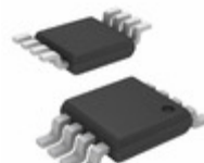
MIC5239-3.0YMM Microchip Technology IC REG LDO 3V 0.5A 8MSOP