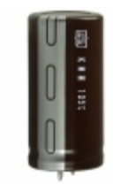
EKMH160VSD473MA45T United Chemi-Con CAP ALUM 47000UF 20% 16V SNAP