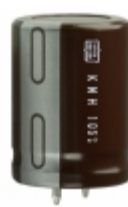
EKMH160VSN103MP30T United Chemi-Con CAP ALUM 10000UF 20% 16V SNAP