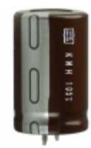
EKMH160VSN123MP35T United Chemi-Con CAP ALUM 12000UF 20% 16V SNAP