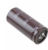
EKMH160VNN683MA63T United Chemi-Con CAP ALUM 68000UF 20% 16V SNAP