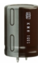
EKMH160VSN123MQ30T United Chemi-Con CAP ALUM 12000UF 20% 16V SNAP