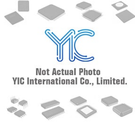
LTC4308IMS8 LT LTC4308IMS8 LT