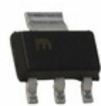
MIC5239-3.15BS TR Microchip Technology IC REG LDO 3.15V 0.5A SOT223