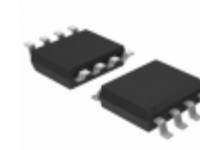
MIC5239-3.15BM-TR Microchip Technology IC REG LDO 3.15V 0.5A 8SOIC