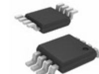
MIC5239-3.15BMM Microchip Technology IC REG LDO 3.15V 0.5A 8MSOP