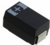
6THB330M Panasonic Electronic Components CAP TANT POLY 330UF 6.3V 2917