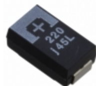
6THB220ML Panasonic Electronic Components CAP TANT POLY 220UF 6.3V 2917