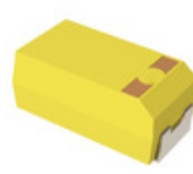
T541X227K016DH8710 KEMET CAP TAN POLYMER COTS SMD 220UF 1