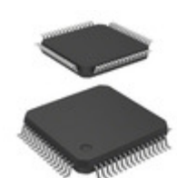
PCF51AC256ACPUE NXP USA Inc. IC MCU 32BIT 256KB FLASH 64LQFP