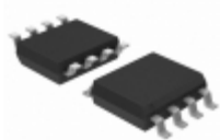
PL602-22SI Microchip Technology IC CLK BUFFER 125MHZ 8SOIC