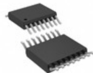
LTC4364CMS-2#TRPBF Linear Technology SURGE STOPPER W/DIODE 16MSOP