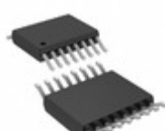
LTC4364CMS-1#TRPBF Linear Technology SURGE STOPPER W/DIODE 16MSOP