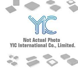
AD7305YRUZ AD AD7305YRUZ AD