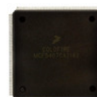
MCF5407CFT162 NXP USA Inc. IC MCU 32BIT ROMLESS 208FQFP