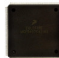
MCF5407AI162 NXP USA Inc. IC MCU 32BIT ROMLESS 208FQFP