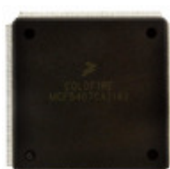
MCF5407FT220 NXP USA Inc. IC MCU 32BIT ROMLESS 208FQFP