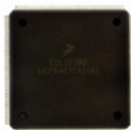
MCF5407AI220 NXP USA Inc. IC MCU 32BIT ROMLESS 208FQFP