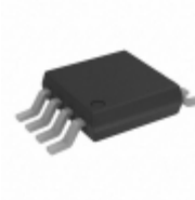
ADG701BRMZ Analog Devices Inc. IC SWITCH SPST 8MSOP