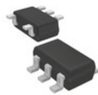
ADG701LBRJ-REEL Analog Devices Inc. IC SWITCH SPST CMOS SOT23-5